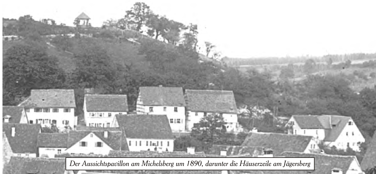
Der Aussichtspavillon am Michelsberg um 1890, darunter die Häuserzeile am Jägersberg

Layout: H. Kellermann – © Altstadtfreunde Gräfenberg 2007